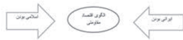
شکل ۱- جنبه‌های الگوی اقتصاد مقاومتی (کریم و همکاران، ۱۳۹۳)

اسلامی بودن آن متناظر به اهداف و آرمان‌های جامعه است و از جنبه ایرانی بودن آن نیز ناظر به مسائل و نیازهای بومی کشور است. (کریم و همکاران، ۱۳۹۳)